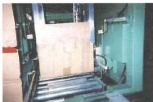
袋インサートアーム部

他、応用設備として製品に袋をかぶせる装置があります。梱包工程でワークにフィルム袋を被せワークを保護します。