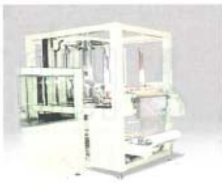
フィルムロールセット部