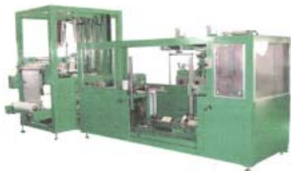
製函機／ポリセッター